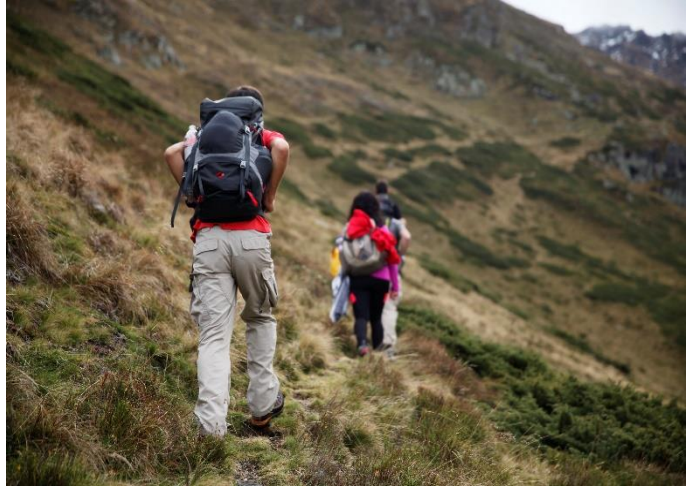
Fig.5 – Shtigje të ecjes në malet e Sharrit

Komuna e Prizrenit është e pasur me atraksione të ndryshme natyrore. Drejtoria për Turizëm dhe Zhvillim Ekonomik (DTZHE), bazuar në hulumtimin që ka bërë, ka arritur të gjej më tepër se 44 pika, ose atraksione natyrore. Bukuria natyrore, lartësia mbidetare, shtigjet e përshtatshme për skijim, ajri i pastër shërues për sëmundjet e zemrës dhe të