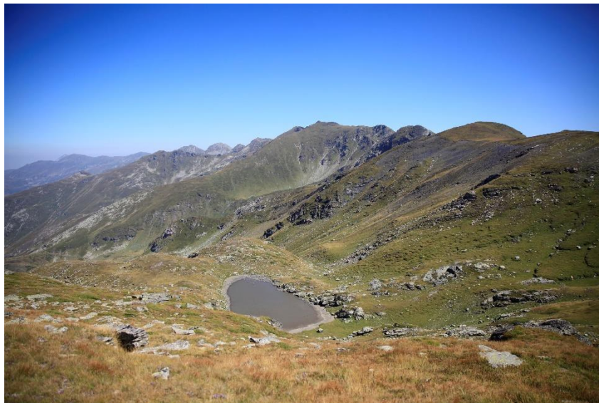
Fig.6 – Liqenet e maleve të Sharrit

tyre. Këtu vlen të përmenden para se gjithash Liqeni i Livadicës dhe Liqeni i Jazhincës, e pastaj edhe liqenet tjera, si liqenet e Gornjasellës, Karanikollës, Miskovës dhe Bezdankës. Liqeni më i madh është ai i Livadicës, e pas tij vjen Liqeni i Jazhincës.